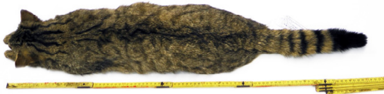
Abb.3. Totfund einer weiblichen Wildkatze bei Schmallenberg-Werntrop, 26.11.2013. Balg im LWL-Museum für Naturkunde.