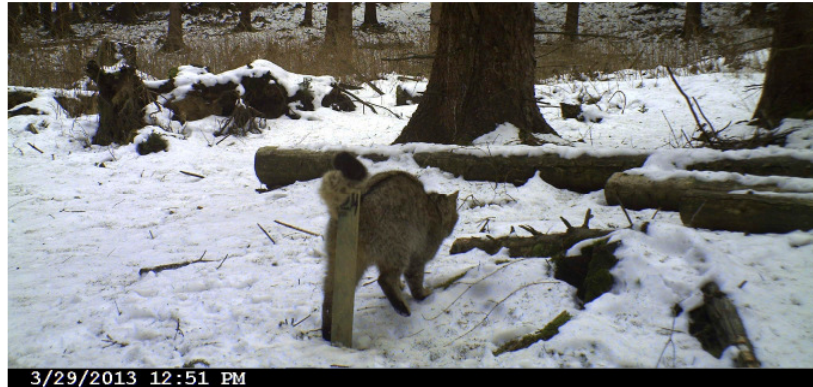
Abb.1. Nachweis der Wildkatze im Raum Brilon-Scharfenberg, HSK. Fotofallenbeleg, März 2013.